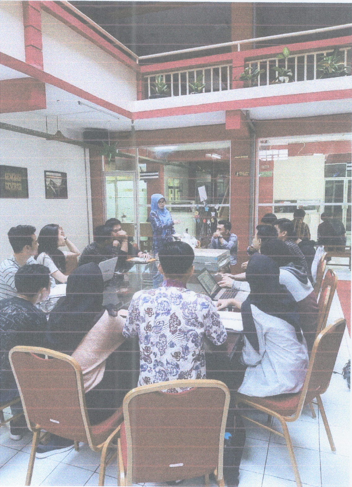
Penyuluhan Bimbingan Pemustaka