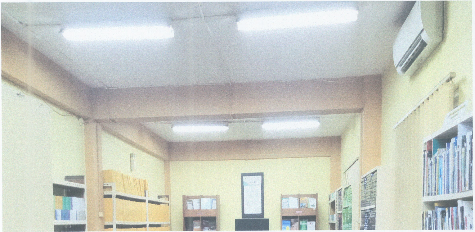
POTO MENGGAMBARAKAN PENCAHAYAAN PERPUSTAKAAN UNIVERSITAS PASUNDAN