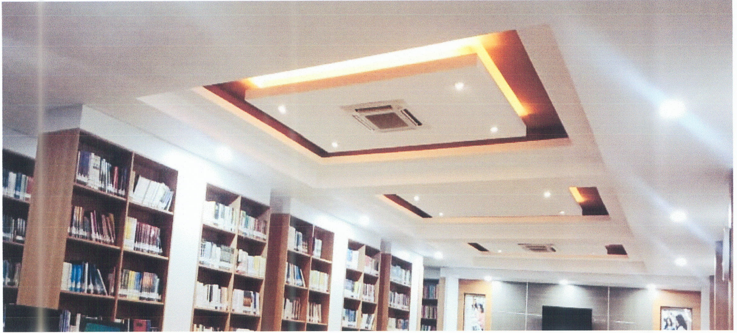
POTO MENGGAMBARAKAN PENCAHAYAAN PERPUSTAKAAN FAKULTAS ILMU SOSIAL DAN ILMU POLITIK